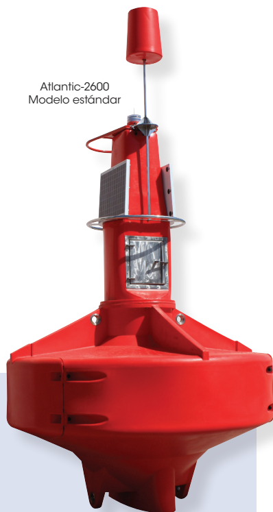
Atlantic-2600 Modelo estándar

El modelo Atlantic-2600-ET incluye torre extensible de 4,1mt