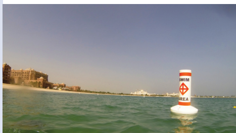
Boya Personalizada SL-B700, Hotel Palace Emiratos, Abu Dhabi

Las boyas Sealite están fabricadas en materiales reciclables. Como servicio al cliente, los componentes individuales de estos productos pueden ser devueltos al final de su vida útil a Sealite para su reciclaje.