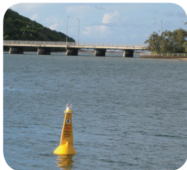
SL-B700 con linterna solar instalada SL-70 Victoria, Australia