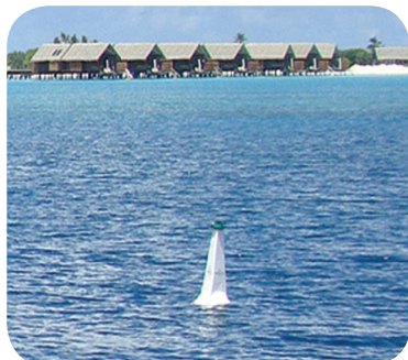
SL-B700 con linterna solar instalada SL-15, Maldivas