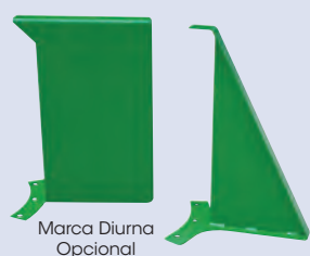
Marca Diurna Opcional