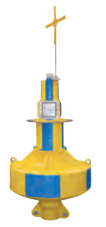
Poseidon-1750 Boya de Naufragio

Sealite tiene una gama de cadenas de fondeo y accesorios- pregunte a su representante como puede suministrarle una solución completa de fondeo